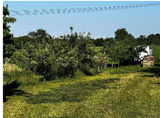
Abbildung 2: niederstämmige Obstbaumkultur