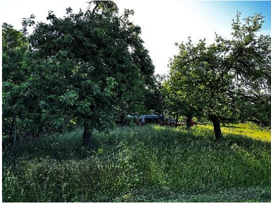
Abbildung 3: Streuobstbestand außerhalb des Geltungsbereichs