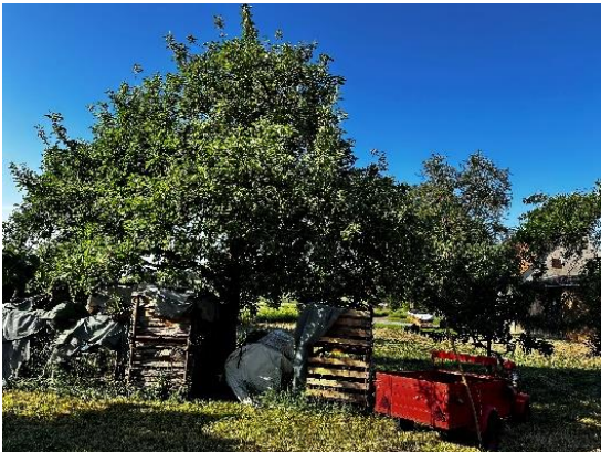
Abbildung 1: Lagerplatznutzung

Mit einem sehr geringen Flächenanteil werden zudem randlich landwirtschaftlich genutzte Flächen (Acker, Fettwiese, Obstgarten) in den Bebauungsplan aufgenommen. Im Bereich des Flurstück Nr. 2946 ist dies ein zu der Hofstelle zugehöriger Obstgarten oder ehemaliger Streuobstbestand, der auf Niederstammkultur zur Obstgewinnung umgestellt wurde. Es handelt sich dabei um einen mittelalten einzelnen hochstämmigen Apfelbaum, eine gekappte abgängige Zwetschge und mehrere Niederstämme auf einer beweideten Fettwiese, die gleichzeitig noch als Lagerplatz für Holz und Material genutzt wird (Abbildung 1). Angrenzend an das Untersuchungsgebiet setzt sich außerhalb des Geltungsbereiches die weitestgehend niederstämmige Obstbaumreihe entlang der Flurstückgrenze fort (Abbildung 2). Ebenfalls außerhalb des Geltungsbereiches befindet sich ein klassischer Streuobstbestand aus hochstämmigen mittelalten Apfelbäumen und alten Kirschbäumen (Abbildung 3). An anderer Stelle auf Flurstück Nr. 2940 findet sich ein ehemaliger Nutzgarten mit eng stehenden, gekappten Zwetschgenbäumen, niederstämmigen Obstbäumen sowie unterpflanzten Nadelgehölzen (Abbildung 4). Gesetzlich geschützte Streuobstbestände sind daher von der Baugebietsausweisung nicht betroffen.