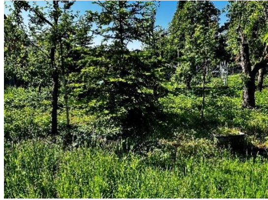
Abbildung 4: ehemaliger Nutzgarten

Die naturschutzfachliche Wertigkeit der im Untersuchungsgebiet erfassten Biotoptypen ist wie folgt zu bewerten: