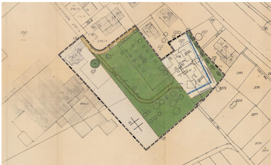
Bebauungsplan „Ziegelrain“ (In Kraft seit 17.04.1997)

Der südöstliche Bereich des Bebauungsplans „Ziegelrain“ liegt innerhalb des Geltungsbereichs „Luisen Höfe“. Die hier bestehenden planungs- und bauordnungsrechtlichen Festsetzungen werden durch die Aufstellung des Bebauungsplans „Luisen Höfe“ aufgehoben.