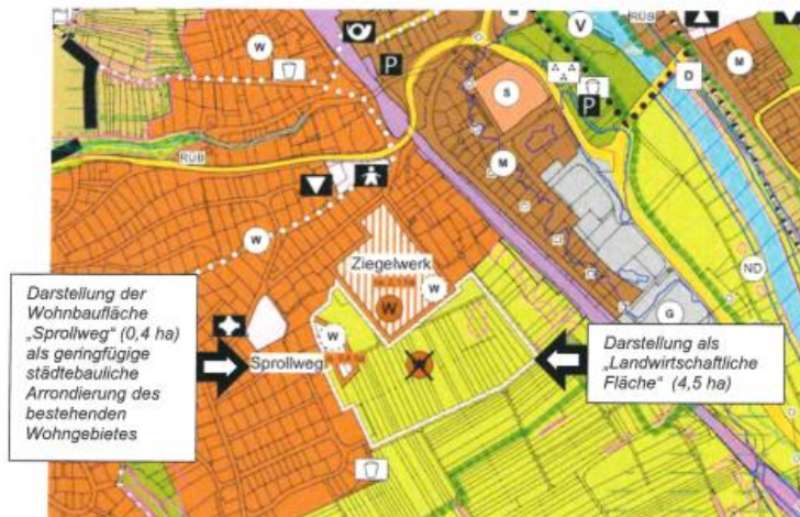
Abb. 1: Der Teilbereich „Besigheim West – Erweiterung Ziegelwerk“ (4,9 ha) kann nicht als Regionaler Wohnbauschwerpunkt entwickelt werden; im Flächennutzungsplan ist künftig die Darstellung als „Landwirtschaftliche Fläche“ (4,5 ha) und als Wohnbaufläche „Sprollweg“ (0,4 ha) vorgesehen

zum Raumordnerischen Vertrag vom 19.09.2022 / 22.11.2022 zwischen dem Verband Region Stuttgart und der Stadt Besigheim