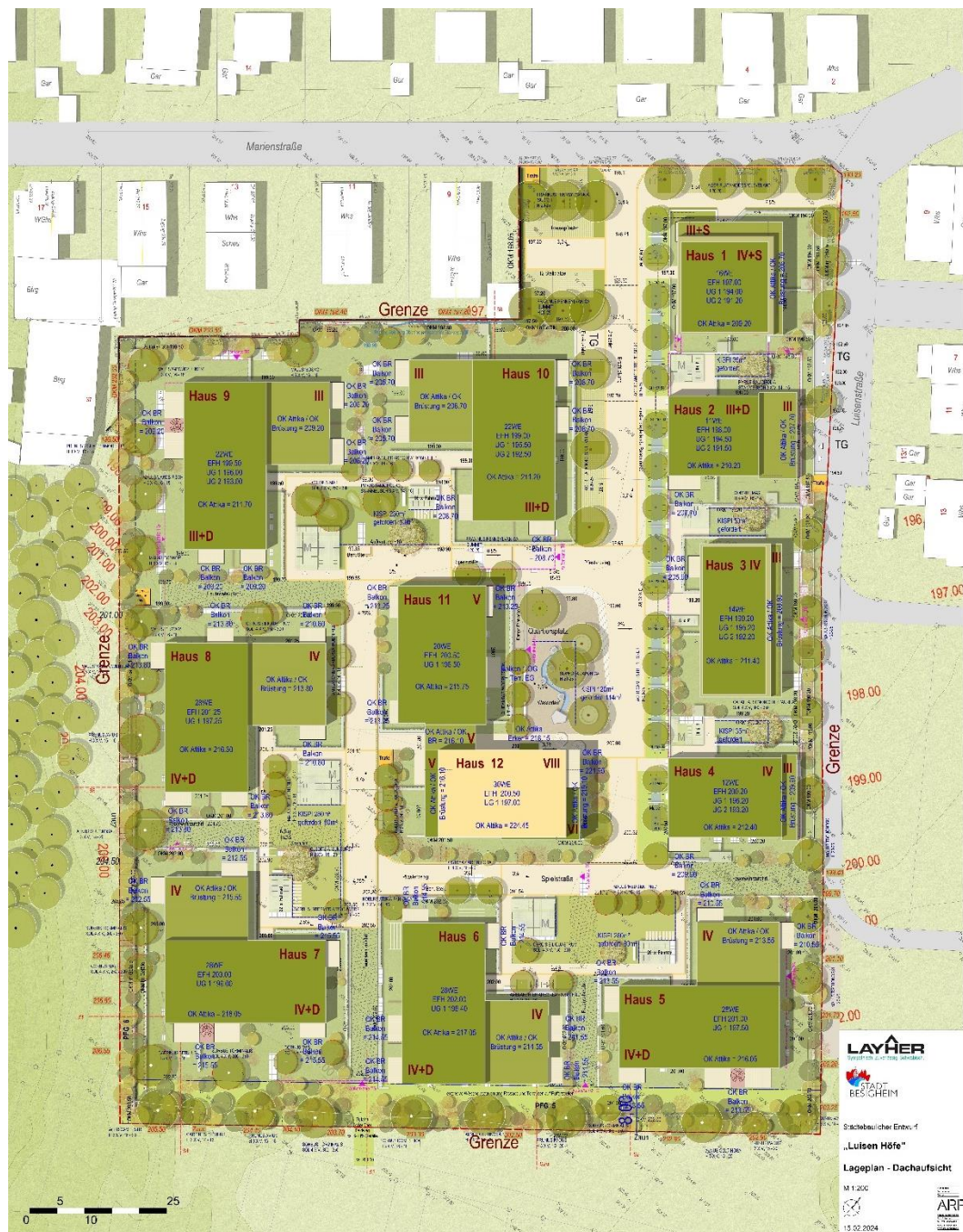
Lageplan Dachaufsicht, Fa. Layher / ARP, Stand 15.02.2024

Der zentrale Quartiersplatz bildet die Quartiersmitte der Luisen Höfe und soll durch seine Lage attraktive Freiräume für zwanglosen Aufenthalt, Kommunikation und als sichere Spielfläche für Kinder bieten. Ergänzt werden, soll dies durch einen halböffentlichen Gemeinschaftsraum im Erdgeschoss des baulichen Hochpunkts.