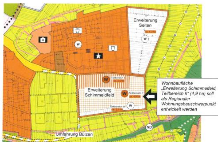
Abb.2 : Die geplante Wohnbaufläche „Erweiterung Schimmelfeld, Teilbereich II“ (4,9 ha) soll als Regionaler Wohnbauschwerpunkt entwickelt werden