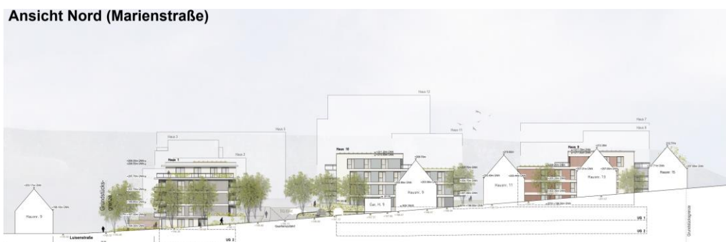
Ansicht Marienstraße, Fa. Layher / ARP, Stand 15.02.2024

Eine Bebauung mit freistehenden Einzelgebäuden und unterschiedlichen Haustypen (Punkt, Zeile, Winkel) schafft differenzierte Räume und Blickbeziehungen. Zur städtebaulich verträglichen Anbindung an den Bestand, halten die neu geplanten Gebäude einen angemessenen Abstand und reagieren in Teilbereichen mit zurückversetzten Dachgeschossen. Die offene Baustruktur soll eine Verzahnung von Bebauung und Freiräumen, mit Blickbeziehungen zwischen dem Quartiersinneren und den Landschaftselementen im Umfeld in Richtung Süden und Südwesten ermöglichen. Dennoch soll die Gebäudestellung im Süden und Westen einen klaren Siedlungsabschluss zur Landschaft und dem angrenzenden Naturdenkmal definieren.